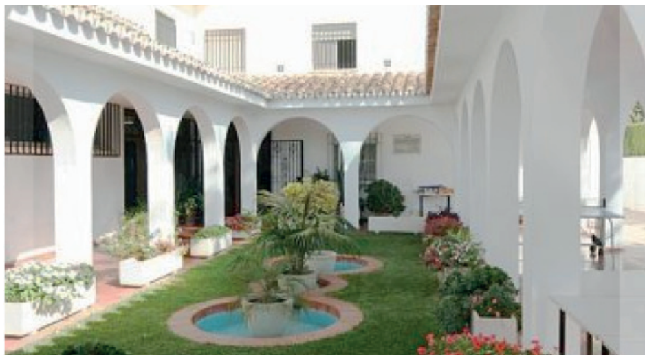
Jardin du centre de Los Rubios

Fondée en 1950, en raison de circonstances historiques qui appelaient le soutien d'Églises-soeurs aux protestants d'Espagne et du Portugal, cette conférence anticipait déjà les formes d'une solidarité trans-nationale en vue du témoignage à rendre à l'Évangile. La CEPPLE rassemble des Églises de traditions théologiques différentes (réformées, luthériennes, épiscopales, vaudoise, baptistes, méthodistes etc...) désireuses de s'épauler mutuellement pour porter ensemble le témoignage des Églises de la Réforme dans les pays latins.