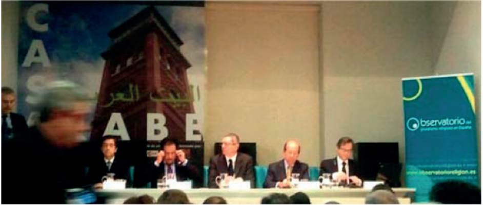
Acte d'ouverture du Congrès